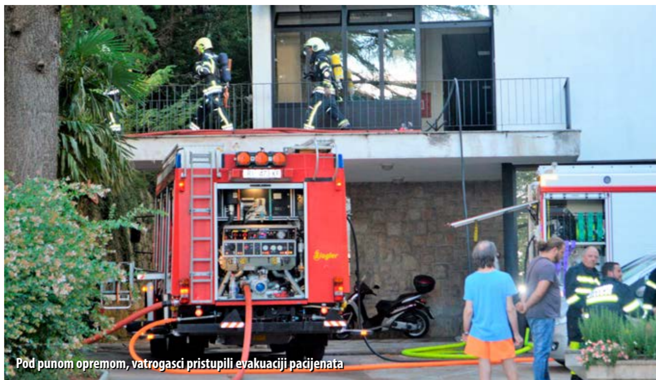
Pod punom opremom, vatrogasci pristupili evakuaciji pacijenata