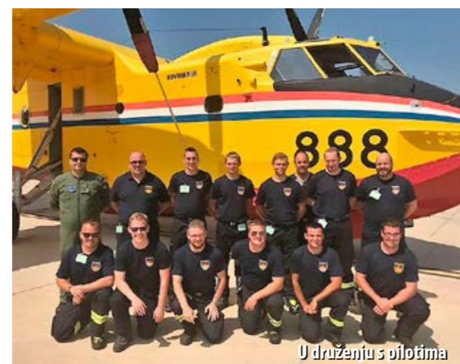
U druženju s pilotima