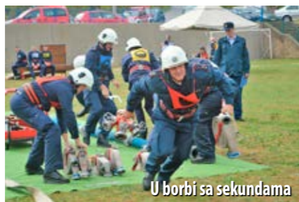
U borbi sa sekundama

tri natjecateljske ekipe, koje su natjecanje završile redoslijedom: DVD Bribir, DVD Škrljevo, DVD Skrad.