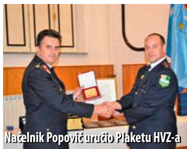
Načelnik Popović uručio Plaketu HVZ-a

Mnogobrojni gosti i ugledni uzvanici čestitali su ravnogorskim vatrogascima na uistinu dugoj vatrogasnoj tradiciji, među njima i načelnik, Mišel Šćuka, koji im je dao najljepši rođendanski dar – obećanje da će Općina Ravna Gora pomoći u nabavi autocisterne. Čestitke su uputili i Slavko Gauš, predsjednik Vatrogasne zajednice PGŽ-a, te Željko Popović, načelnik HVZ-a.