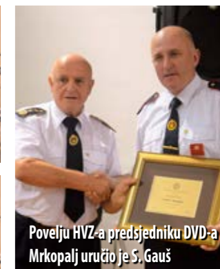
Povelju HVZ-a predsjedniku DVD-a Mrkopalj uručio je S. Gauš