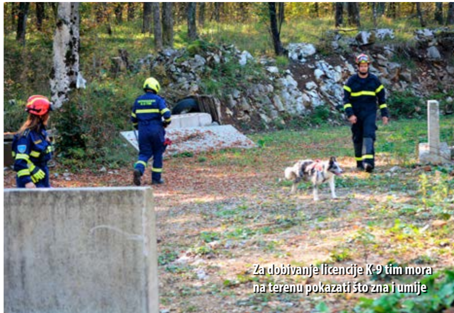
Za dobivanje licencije K-9 tim mora na terenu pokazati što zna i umije

- Za dobivanje licencije treba zadovoljiti tri segmenta. Prvi segment je teorijski ispit za vodiča koji se polaže kada