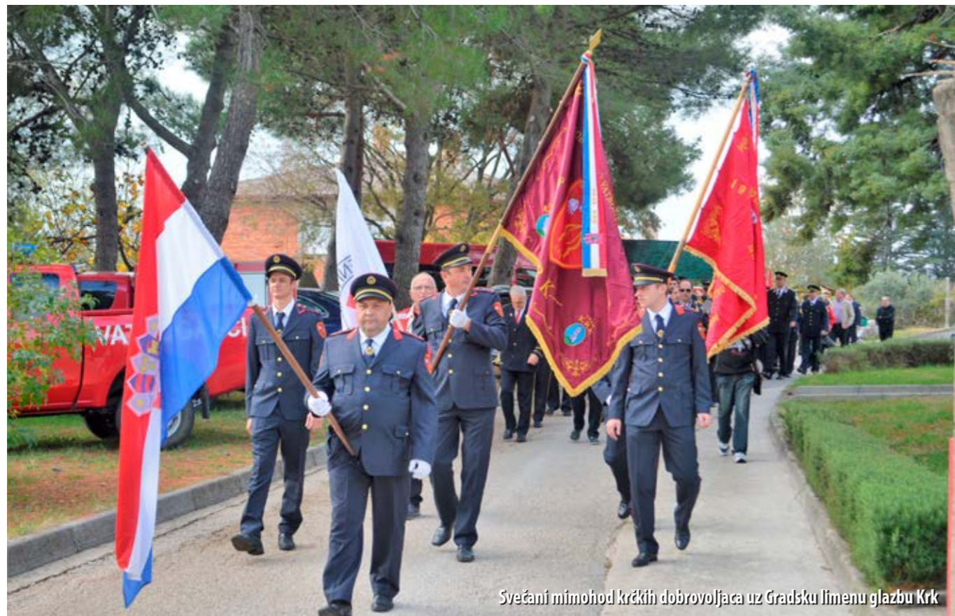
Svečani mimohod krčkih dobrovoljaca uz Gradsku himnu glazbu Krk

DVD Krk nije osnovan 1947., već 1908. godine. Potvrdili su to dokumenti pronađeni u tršćanskome Državnom arhivu, čime je DVD-u Krk zaslužen pripao status najstarijeg društva na otoku Krku, a sredinom studenog proslavljena je 110. obljetnicu njegovoga uspješnog rada.