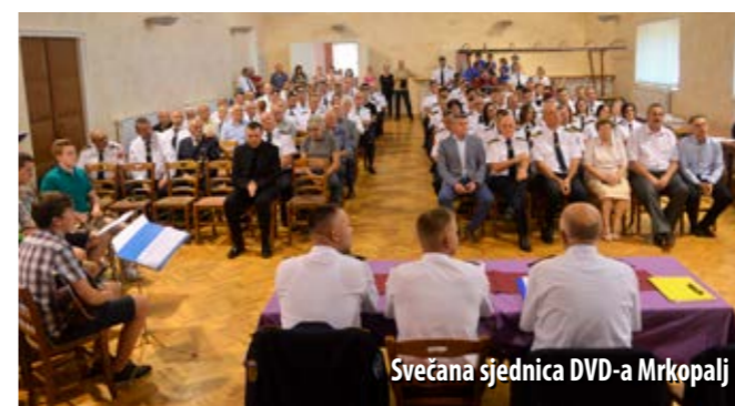
Svečana sjednica DVD-a Mrkopalj