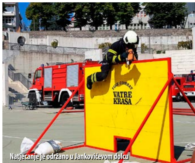
Natjecanje je održano u Jankovićevom dolcu

Nakon natjecanja, druženje ekipa nastavljeno je u vatrogasnom domu DVD-a Kras u Šapjanama, a pehare najboljima