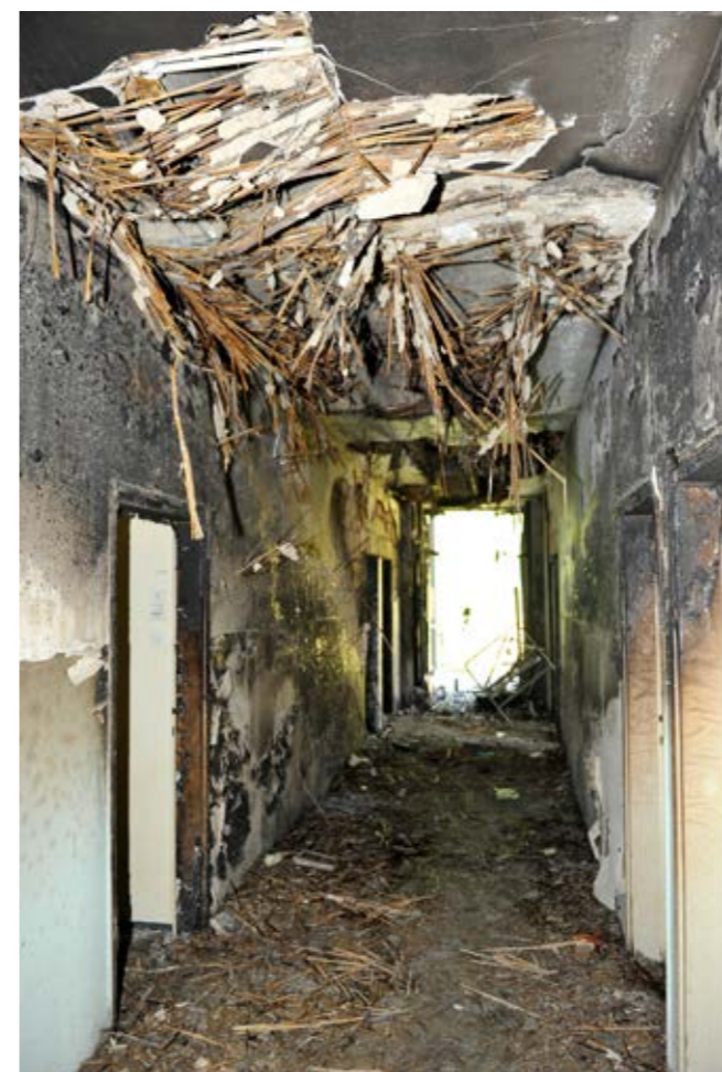
Posljedice požara dugo će se sanirati

na riječki lokalitet KBC-a. Pomoć su zatražile i dvije medicinske sestre koje su u jednom trenutku s 10-ak pacijenata ostale zarobljene u bolničkoj ambulanti. Nakon intervencije, u večernjim satima, na Hitnoj je završio i jedan dobrovoljac iz DVD-a Jelenje koji se nagutao dima, budući da pri ulasku u zadimljenu zgradu i evakuaciji pacijenata nije koristio dišni aparat. Nasreću, nikakvih dugoročnih zdravstvenih posljedica nije imao.