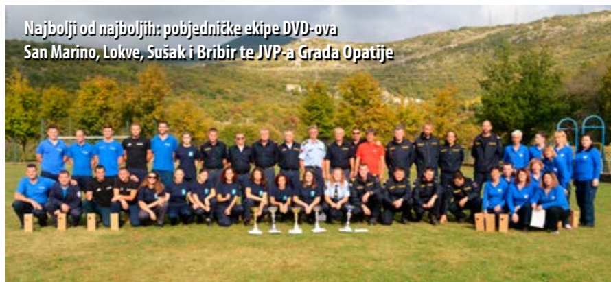
Najbolji od najboljih: pobjedničke ekipe DVD-ova San Marino, Lokve, Sušak i Bribir te JVP-a Grada Opatije

Ove godine nastupile su 23 ekipe, u pet kategorija. U kategoriji muški - A sudjelovalo je sedam ekipa, a pobijedio je DVD San Marino. Drugi je bio DVD Crikvenica, a treći DVD Škrljevo. U kategoriji muški - B također se nadmetalo sedam ekipa, a tri najbolje plasirane bile su: DVD Lokve, DVD Delnice i DVD Škrljevo. U kategoriji PVP - A nastupio je JVP Grada Opatije, bez konkurencije. U kategoriji žene - A nastupilo je pet ekipa, a pobijedio je DVD Sušak, ispred DVD-a San Marino i DVD-a Klana. Na posljednjem natjecanju, u kategoriji žene - B bile su