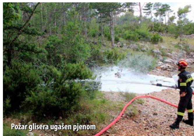
Požar glisera ugašen pjenom