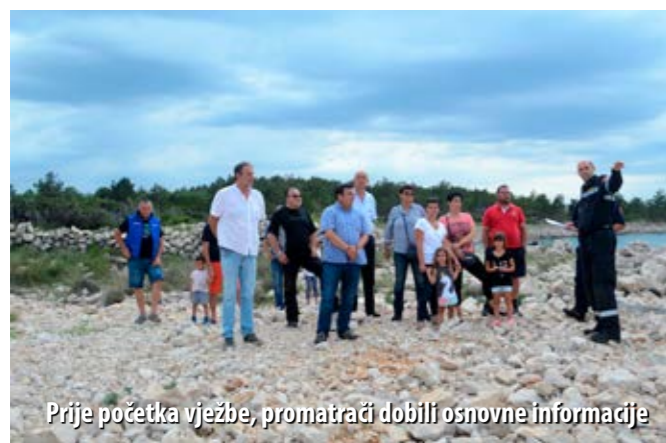
Prije početka vježbe, promatrači dobili osnovne informacije