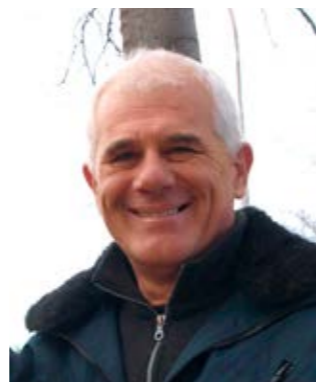
Piše: Slavko Suzić

Iz sačuvanih fotografija, koje se nalaze na zidu upravne zgrade JVP-a Grada Rijeke, može se zaključiti da je Tvornica papira doživjela poplave i u razdoblju od 26. do 28. listopada 1885. godine, kao i 1886. godine. O tim poplavama