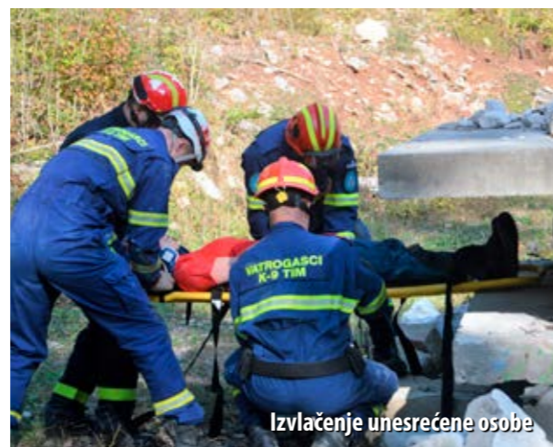
Izvlačenje unesrećene osobe