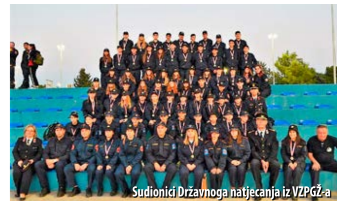
Sudionici Državnoga natjecanja iz VZPGŽ-a

Postignuti rezultati u skladu su sa očekivanjima. Za istaknuti je 7. mjesto muške mladeži DVD-a San Marino čime su dečki iz Novog za jedno mjesto popravili (svoje) najbolje postignuće ekipa mladeži VZPGŽ-a na državnim smotrama. U zlatnu grupaciju 15. mjestom plasirala se i ženska ekipa iz Novog. DVD Kras i DVD Sušak plasirali su se u srebrnu grupaciju u muškoj konkurenciji, dok su nešto skromnije bile ekipe DVD-a Klana i DVD-a Škrlevo u ženskoj konkurenciji, ostvarivši plasman u brončanoj grupaciji.