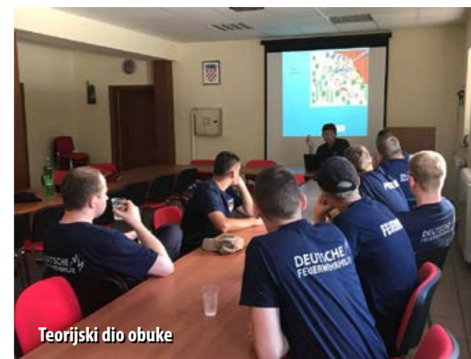
Teorijski dio obuke

U sklopu boravka u Hrvatskoj, posjetili su i Državni vatrogasni centar u Divuljama te Zračnu luku Zemunik, gdje su u druženju s pilotima kanadera obišli hrvatske zračne vatrogasne resurse. Tom su prilikom posjetili i JVP Split, a domaćini su im bili i članovi DVD-a Kaštel Gomilica.