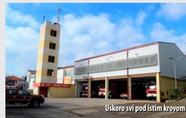
Uskoro svi pod istim krovom

U suradnji s otočnom i županijskom vatrogasnom zajednicom, Društvo kontinuirano ulaže i u opremu, a 2014. godine pokrenut je i veliki projekt izgradnje vatrogasnoga doma. Novi dom krčkih dobrovoljaca gradi se u produžetku zgrade JVP-a Grada Krka, a trebao bi biti dovršen do kraja ove godine. DVD Krk tako će napokon dobiti odgovarajući prostor sa skladištem, garažom i društvenim prostorijama. Investicija je vrijedna 1,2 milijuna kuna, a sredstva su osigurali Grad Krk, vatrogasne zajednice otoka Krka i županije te sam DVD Krk.