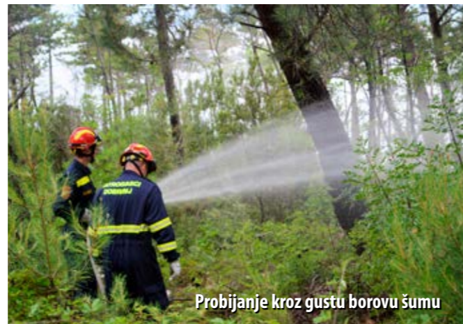
Probijanje kroz gustu borovu šumu