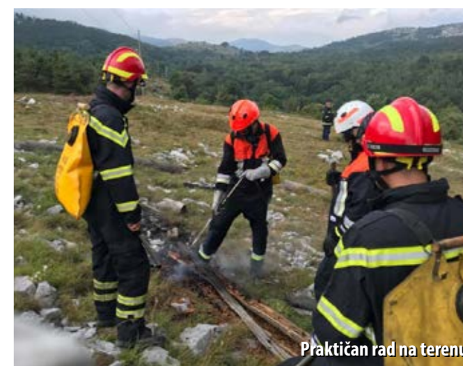
Praktičan rad na terenu

Organizacija „Njemački vatrogasci pomažu“ ove je godine zajedno s DVD-om San Marino - Novi Vinodolski organizirala obuku za gašenje požara šume i raslinja, čime je dosadašnja suradnja njemačkih i novljanskih vatrogasaca poprimila jednu novu dimenziju. Sa svrhom osposobljavanja njemačkih vatrogasaca za gašenje požara otvorenog prostora, koji baš nisu česti u gradovima iz kojih dolaze, ove je godine taj program osposobljavanja organiziran u Novom Vinodolskom. Teoretski dio osposobljavanja odrađen je u organizaciji VZPGŽ-a u Vatrogasnom obučnom centru Šapjane. Praktični dio, koji je obuhvatio treninge izdržljivosti, vježbe i primjenu znanja na intervencijama, odrađen je u Novom Vinodolskom. Uz vježbe i treninge sa svojim domaćinima, vatrogasci iz Njemačke, kojima su se pridružili i kolege iz Finske i Rusije, sudjelovali su u preventivnim opodnjama terena za vrijeme velike i vrlo velike opasnosti za izbijanje požara otvorenog prostora, kao i na nekim manje zahtjevnim intervencijama.