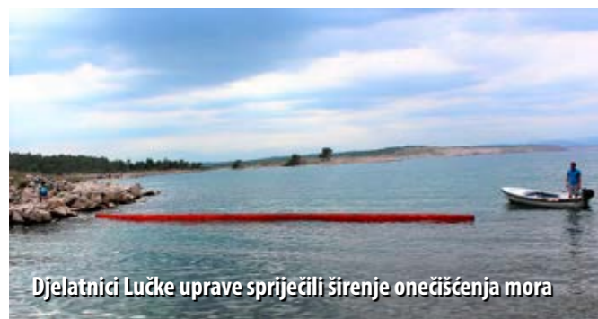
Djelatnici Lučke uprave spriječili širenje onečišćenja mora