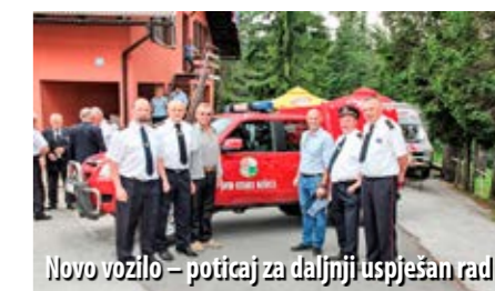
Novo vozilo – poticaj za daljnji uspješan rad