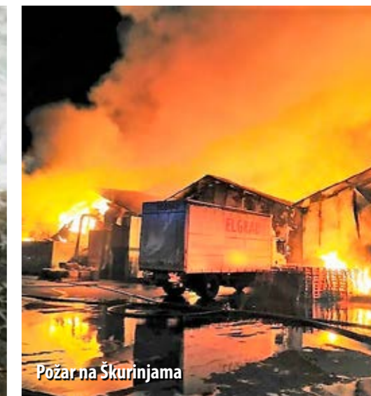
Požar na Škurinjama

Ako ne bude nekih iznenađenja tijekom prosinca, ova će godina, što se tiče broja intervencija, za Vatrogasnu zajednicu PGŽ-a biti ispodprosječna. Naime, ukupan broj intervencija manji je negoli prethodnih godina za 10-ak posto. No, to ne znači da su vatrogasne postrojbe kroz godinu prošle „glatko“. Naime, kako ističe županijski vatrogasni zapovjednik Mladen Ščulac, proteklo jednogodišnje razdoblje obilježilo je nekoliko velikih i iznimno zahtjevnih intervencija.