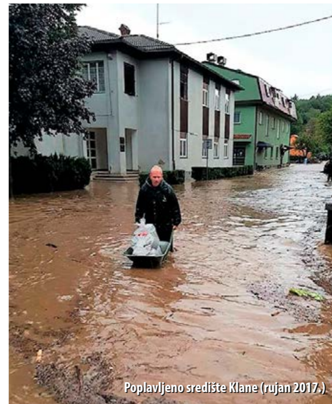
Poplavljeno središte Klane (rujan 2017.)

Iznimno jaki vjetrovi puhali su nad Kvarnerom i 2013. i 2014. godine, a slična situacija ponovila se i 2016. godine, u travnju, kada su zbog golemih valova, opatijski vatrogasci morali vezivati automobile da ih more ne odnese. Primorsko-goranski vatrogasci pamte i prošlu godinu, kada je u svega nekoliko dana došlo do velikog vremenskog preokreta. Naime, početkom rujna vatrogasci su se još borili s požarima, a na snazi je bila vrlo velika opasnost od požara. Samo nekoliko dana kasnije zabilježene su nesvakidašnje poplave, a osobito teško bilo je pogođeno mjesto Klana, u zaleđu Rijeke.