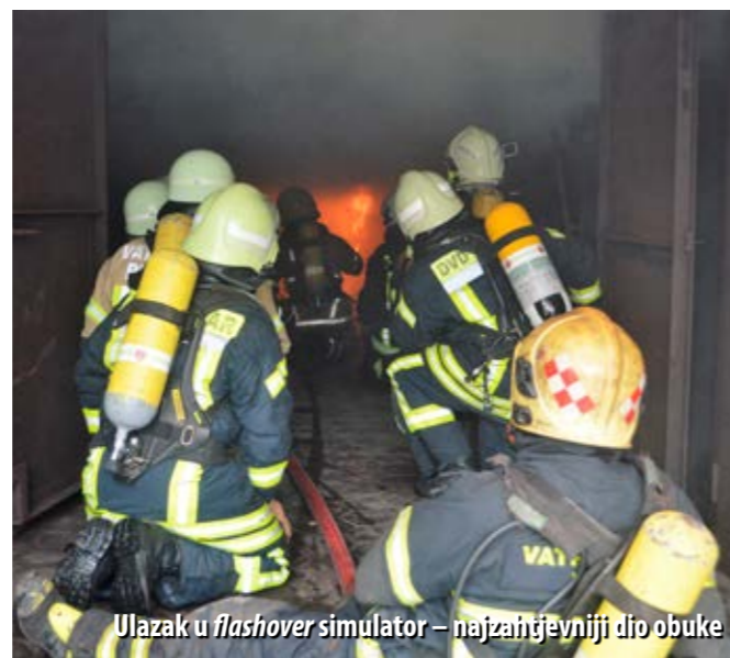
Ulazak u flashover simulator – najzahtjevniji dio obuke