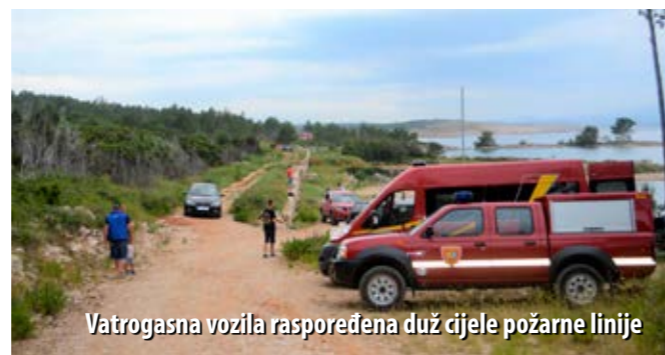
Vatrogasna vozila raspoređena duž cijele požarne linije

U oči ljetne požarne sezone, krčki su vatrogasci, tradicionalno, održali veliku vatrogasnu vježbu sa svrhom provjere spremnosti, koordinacije i tehničke opremljenosti otočnih vatrogasaca, prilikom većeg požara otvorenog prostora.