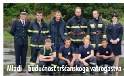
Mladi – budućnost tršćanskoga vatrogastva

meni orkestar, koji je uspješno nastupao niz godina.