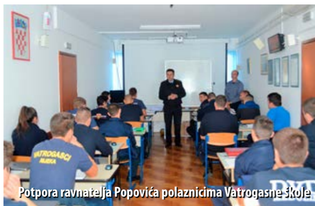
Potpora ravnatelja Popovića polaznicima Vatrogasne škole

Potkraj rujna startala je nova školska godina u Vatrogasnoj školi – Poslovnoj jedinici u Rijeci, a u klupe je sjela osma generacija polaznika, njih 32. Ove godine najveći broj polaznika je iz Istarske, potom Primorsko-goranske županije, no, ima ih i iz drugih krajeva Hrvatske: Korenice, Đelekovca, Zadra, Senja, Sikova.