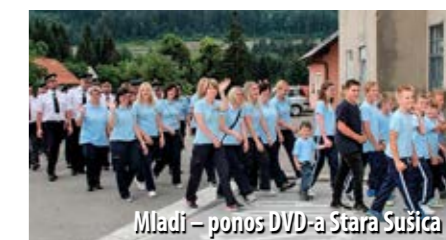
Mladi – ponos DVD-a Stara Sušica