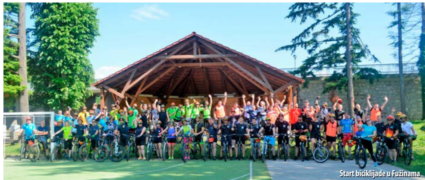
Start biciklijade u Fužinama