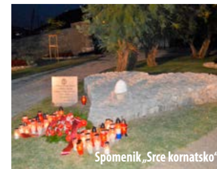
Spomenik „Srce kornatsko“