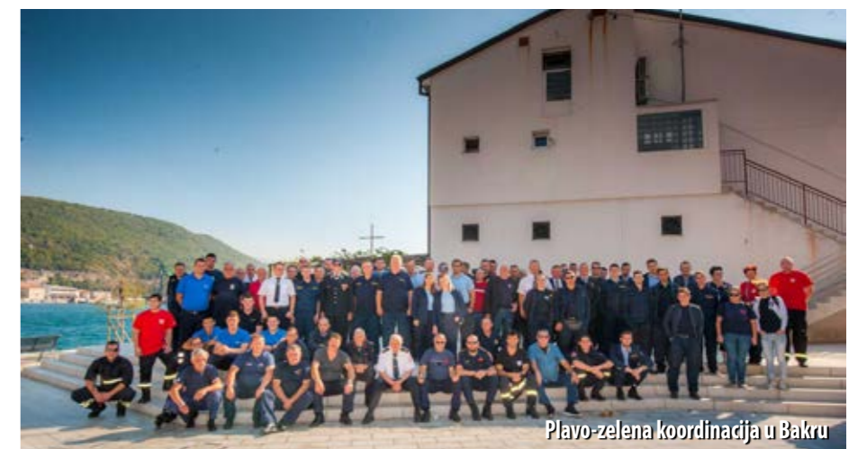
Plavo-zelena koordinacija u Bakru