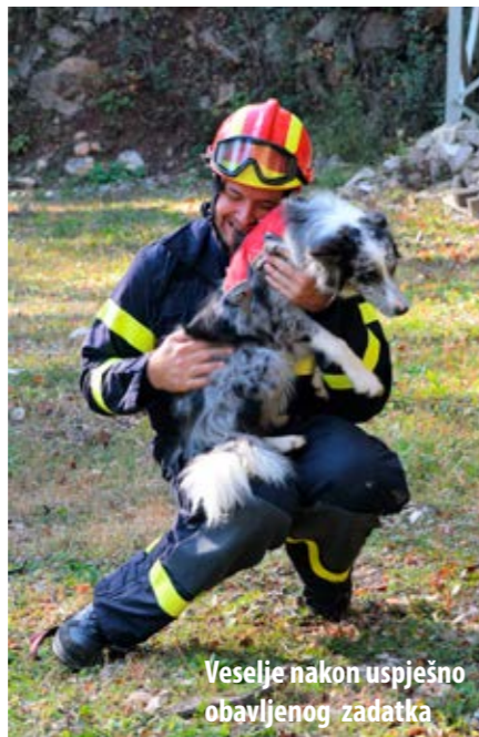
Veseli nakon uspješno obavljenog zadatka

vodič prvi put izlazi na licenciranje, a ispitna pitanja kombinacija su vatrogasnog i kinološkog znanja, kako bi se dobila kompletna slika o osposobljenosti kandidata za vodiča potražnog psa u vatrogastvu. Drugi segment je vodljivost, na kojoj se provjerava kako kandidat sa svojim psom prolazi prepreke te kakva je poslušnost potražnog psa u okolnostima kada ga se ometa, bilo da to čine druge osobe ili drugi psi, a sve sa svrhom provjere smirenosti psa i kontrole vodiča nad njim. Treći segment je samo pretraživanje ruševine. Ono se obavlja na ruševini veličine minimalno 1500 m 2 . Vodič, uz pomoć psa, mora pronaći skrivene markirante, njih najmanje dvoje. Pronalazak markiranata pas može označiti lajanjem, cviljenjem, kopanjem ili na druge