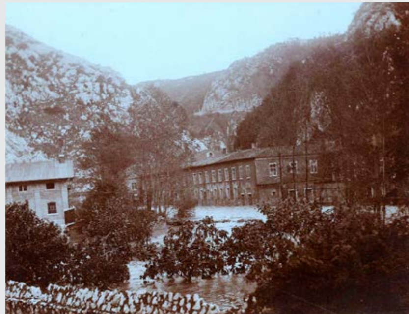
Fotografija prikazuje poplavu Rječine u krugu Tvornice papira od 26. do 28. listopada 1885. godine. Riječki vatrogasci četiri dana i noći nadljudskim naporima spašavali su vodenom bujicom ugroženo područje Grohovo i tzv. „Mlinove“, što je izvorni naziv za područje od Školjića do Tvornice papira.

nema pisanih podataka, ali fotografije ukazuju na ozbiljnost događaja koji su, najvjerojatnije, oštetili i Tvornicu papira.