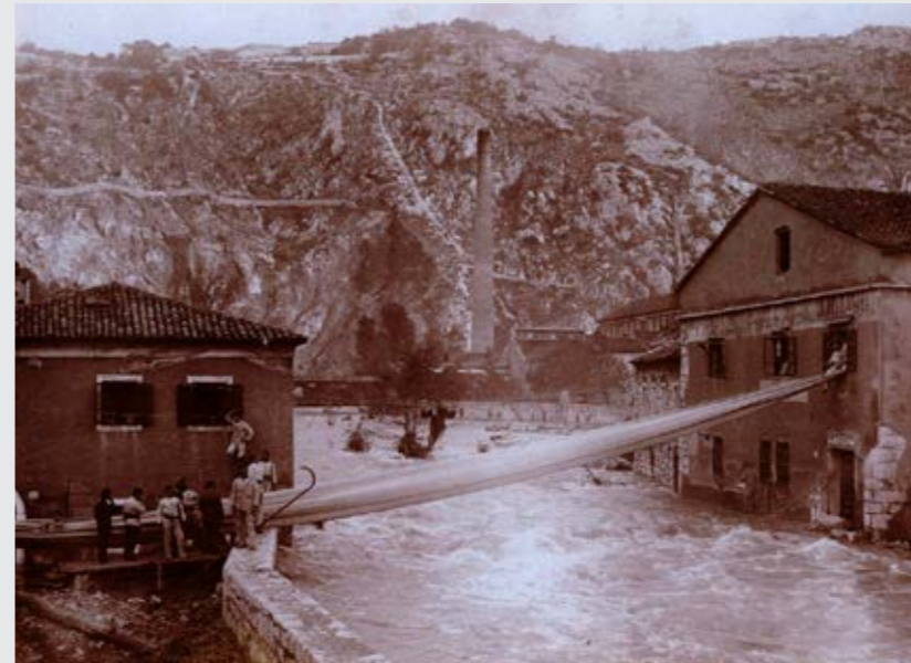
Fotografija prikazuje vatrogasnu intervenciju kod spašavanja stanovništva preko nabujale Rječine nizvodno od Tvornice papira 1886. godine. Poplavljena je bila i cijela Delta s dijelovima grada.