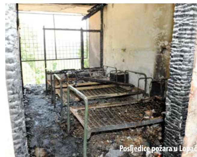
Posljedice požara u Lopači

Ako ne bude nekih iznenađenja tijekom prosinca, ova će godina, što se tiče broja intervencija, za Vatrogasnu zajednicu PGŽ-a biti ispodprosječna. Naime, ukupan broj intervencija manji je negoli prethodnih godina za 10-ak posto. No, to ne znači da su vatrogasne postrojbe kroz godinu prošle „glatko“. Naime, kako ističe županijski vatrogasni zapovjednik Mladen Ščulac, proteklo jednogodišnje razdoblje obilježilo je nekoliko velikih i iznimno zahtjevnih intervencija.