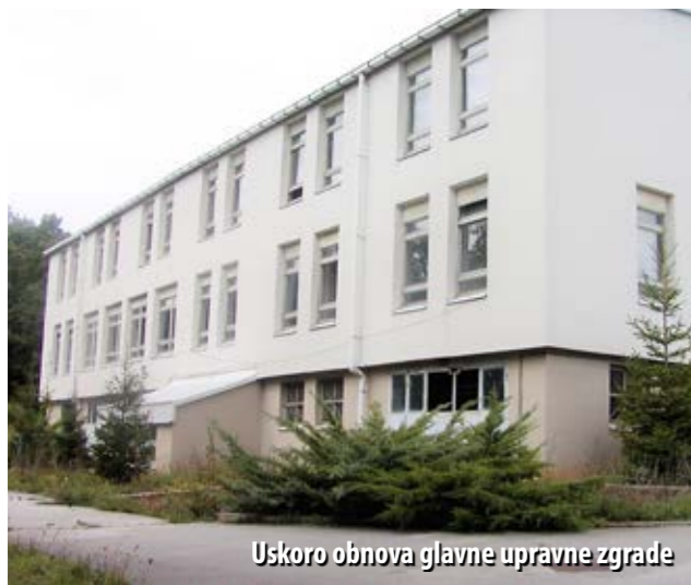
Uskoro obnova glavne upravne zgrade

tara, sastavljen od pomičnih dijelova, koji će se moći slagati na različite načine. Investicija je vrijedna 250 tisuća kuna, a sredstva za taj projekt osigurala je Primorsko-goranska županija, kroz kapitalna ulaganja, kazao je Šćulac.