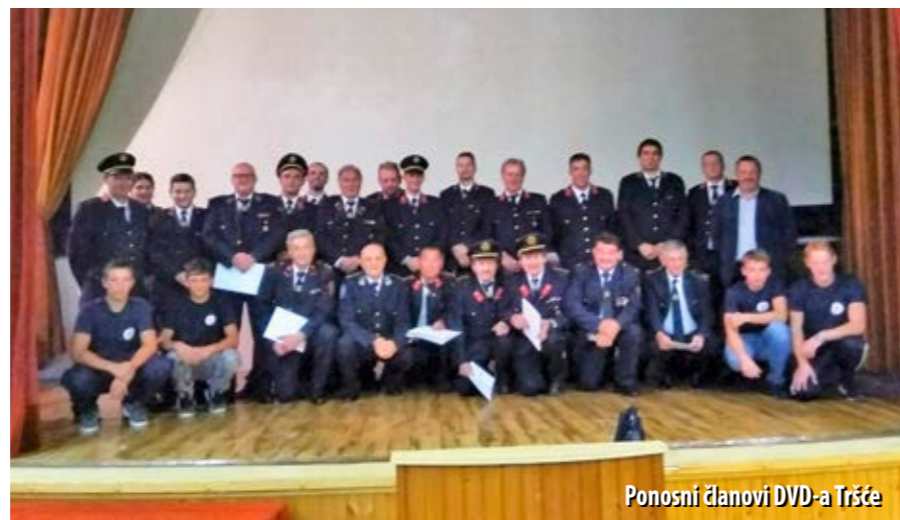
Ponosni članovi DVD-a Tršće

Prva motorna vatrogasna štrcaljka TMZ kupljena je 1960. godine. Osam godina kasnije zamijenjena je većom, suvremenijom i funkcionalnijom, a 1975. godine tadašnji Vatrogasni savez općine Čabar poklonio je DVD-u Tršće još jednu motornu štrcaljku. Godine 1976. nabavljeno je opremljeno vatrogasno vozilo IMV 1600, koje je društvu uspješno služilo do kraja devedesetih godina prošloga stoljeća. Novčane priloge za spomenuto vozilo dalo je čak 301 domaćinstvo, a pomogla su i sva tadašnja poduzeća na području Čabra. U sklopu Dobrovoljnoga vatrogasnog društva 1978. godine utemeljen je li-