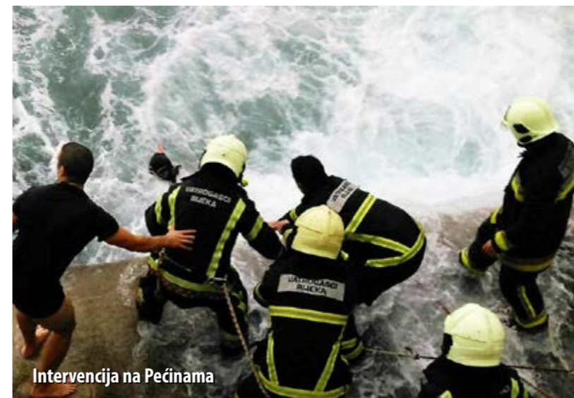
Intervencija na Pećinama

Godinu na izmaku u Vatrogasnoj zajednici PGŽ-a pamtit će po nekoliko iznimno zahtjevnih intervencija, ali i po uspješno pokrenutim projektima koji su od strateške važnosti za daljnji razvoj županijskoga vatrogastva.