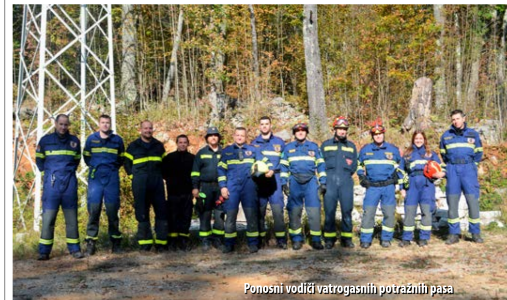
Ponosni vođači vatrogasnih potražnih pasa

Prvi potražni psi u hrvatski vatrogasni sustav uključeni su 2012. godine. Diljem Hrvatske, danas u vatrogasnim postrojbama djeluje 20 K-9 timova, a broj se povećava iz godine u godinu. U pronalaganju nestale ili zatrpane osobe, potražni psi deset su puta brži i učinkovitiji od ljudi, a za svoj predan rad ne traže mnogo – samo pohvalu, ljubav i pokoji slasni zalogaj.