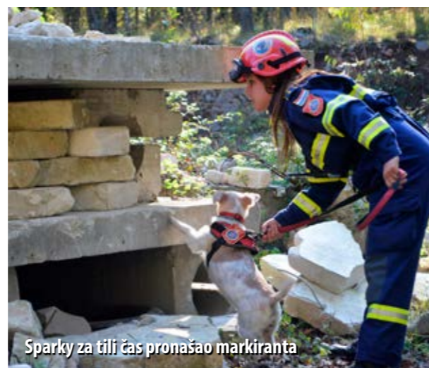
Sparky za tili čas pronašao markiranta