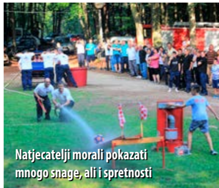
Natjecatelji morali pokazati mnogo snage, ali i spretnosti

konkurenciji Skradanke su ponovno bile bolje od konkurentica iz Stare Sušice.