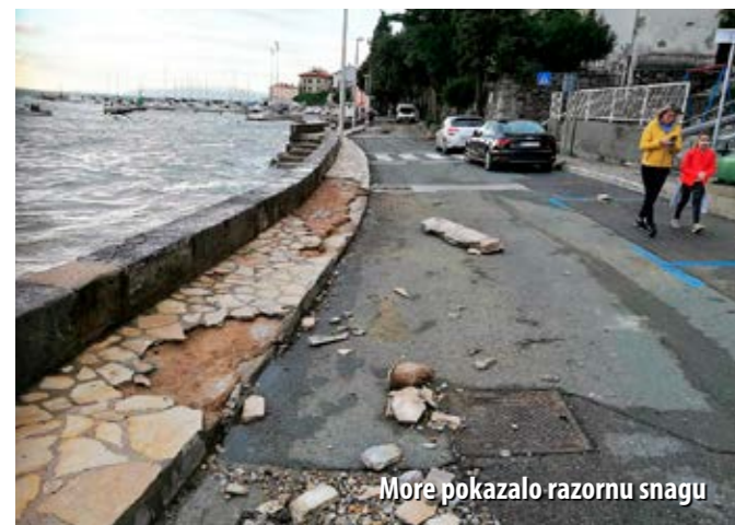
More pokazalo razornu snagu

Najteže posljedice pretrpjela je opatijska rivijera, osobito Volosko. Prema prvim procjenama, šteta iznosi najmanje dva milijuna kuna, a gradske vlasti zatražile su proglašenje elementarne nepogode.