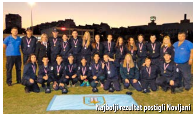
Najbolji rezultat postigli Novljani

Na natjecanju u Zadru koje je bilo organizirano na visokoj razini, ekipe VZPGŽ-a dostojanstveno su predstavile svoja društva i županiju. Uzornim ponašanjem za vrijeme natjecanja, ali i izvan stadiona, zaslužili su sve pohvale. Ekipe VZPGŽ-a predvodila je predsjednica Savjeta za vatrogasnu mladež VZPGŽ-a, Renata Topolovec, koja je ujedno bila i službeni predstavnik VZPGŽ-a na natjecanju u Zadru. U Zadru je bilo i pet sudaca VZPGŽ-a, na čelu s predsjednikom Komisije za natjecanja VZPGŽ-a, Klaudijom Filčićem, a na svečanosti zatvaranja natjecanja bio je i županijski vatrogasni zapovjednik, Mladen Šćulac.