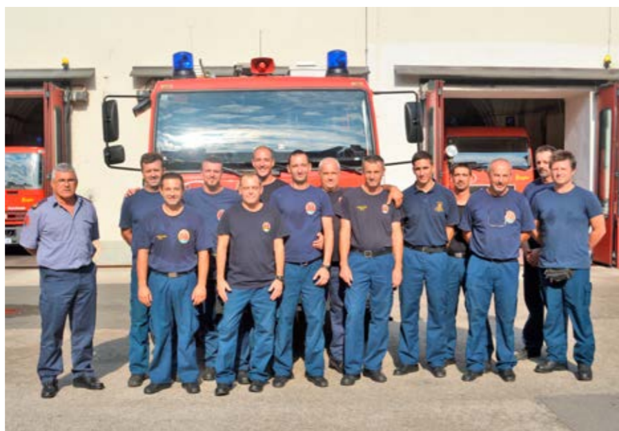
Pripadnici JVP-a Rijeka, postaja Centar i Vežica, redom iskusni vatrogasci, slažu se da je intervencija u Lopači bila jedna od zahtjevnijih

U spašavanju pacijenata i osoblja Bolnice sudjelovalo je i više timova HMP-a iz Rijeke i Crikvenice, a mjesto intervencije osiguravale su i policijske snage. Unatoč velikim naporima vatrogasaca i djelatnika Bolnice, jedan je pacijent smrtno stradao. Petnaestak pacijenata zatražilo je medicinsku pomoć te su kolima Hitne medicinske pomoći prebačeni u KBC Sušak, dok je jedan pacijent s težim opeklinama prebačen