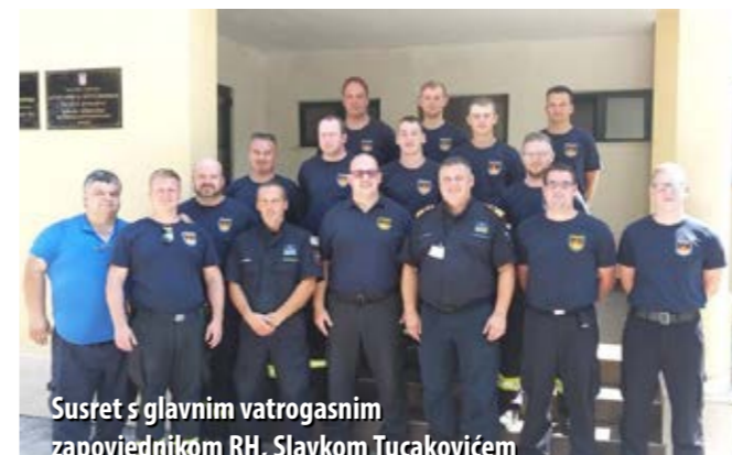
Susret s glavnim vatrogasnim zapovjednikom RH, Slavkom Tucakovićem