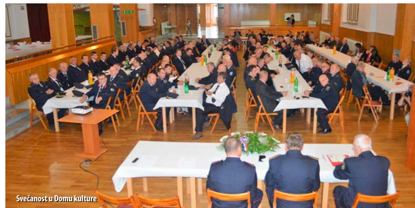
Svečanost u Domu kulture

Nemjerljiv je doprinos zajednici koji su u 130 godina predanoga rada ostvarili ravnogorski vatrogasci. Spasili su mnoge živote i sačuvali velike materijalne vrijednosti. S ponosom čuvaju uspomene na prošlost, a s optimizmom gledaju u budućnost.