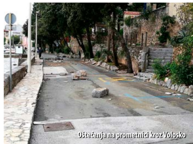
Oštećenja na prometnici kroz Volosko