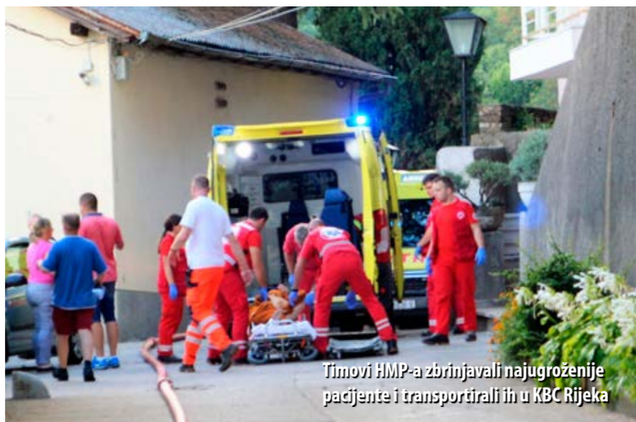
Timovi HMP-a zbrinjavali najugroženije pacijente i transportirali ih u KBC Rijeka