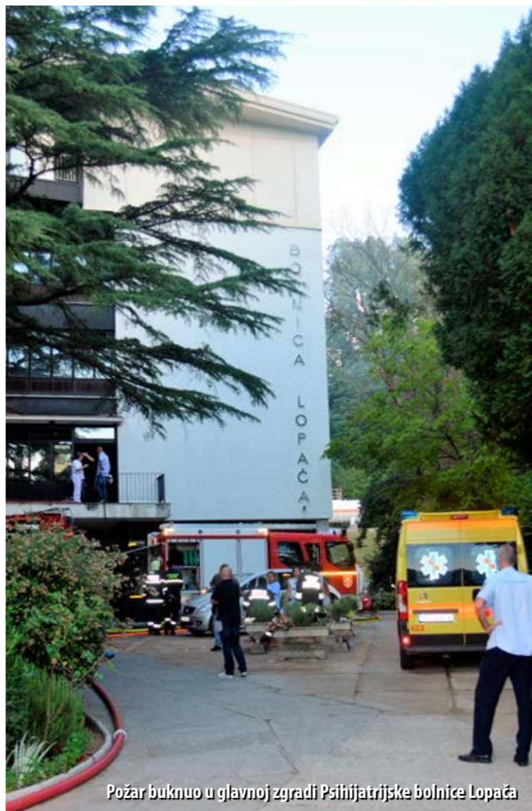
Požar buknuo u glavnoj zgradi Psihijatrijske bolnice Lopača

Naposljetku, županijski vatrogasni zapovjednik izdvojio je i županijsku vatrogasnu vježbu koja je ove godine, uoči sezone, održana je na Rabu te je u tom kontekstu pohvalio rapske vatrogasce za iznimnu organizaciju te vježbe i koordinaciju s kopnenim snagama.