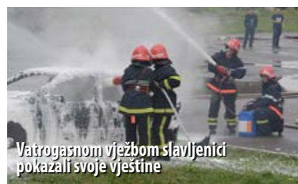
Vatrogasnom vježbom slavljenici pokazali svoje vještine