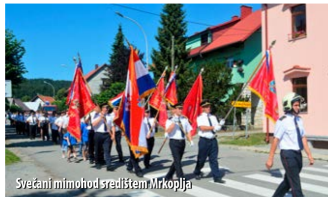
Svečani mimohod središtem Mrkoplja

Sredinom srpnja ponosni Mrkopaljci proslavili su izniman događaj – 120. obljetnicu njihovog DVD-a. Riječ je o društvu koje od osnutka do danas prati svaki važniji događaj u mjestu te marljivo baštini tradiciju i plemenitost vatrogastva.