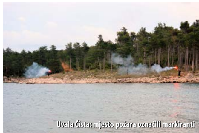
Uvala Čista: mjesto požara označili markiranti