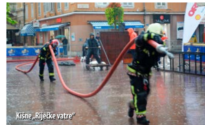
Kišne „Riječke vatre“

Potkraj rujna u središtu Rijeke održane su 11. „Riječke vatre“, natjecanje „fire combat“, koje je ove godine privuklo 40 ekipa, od čega tri ženske, iz Hrvatske, Slovenije i BiH. Zahtjevno i vrlo naporno natjecanje ove je godine, kao i prije osam godina, dodatno otežala kiša, ali vatrogasce to ni najmanje nije omelo te su s mnogo adrenalina i pozitivne sportske energije redom dolazili na startnu poziciju.