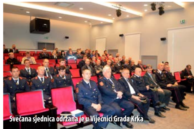
Svečana sjednica održana je u Vijećnici Grada Krka