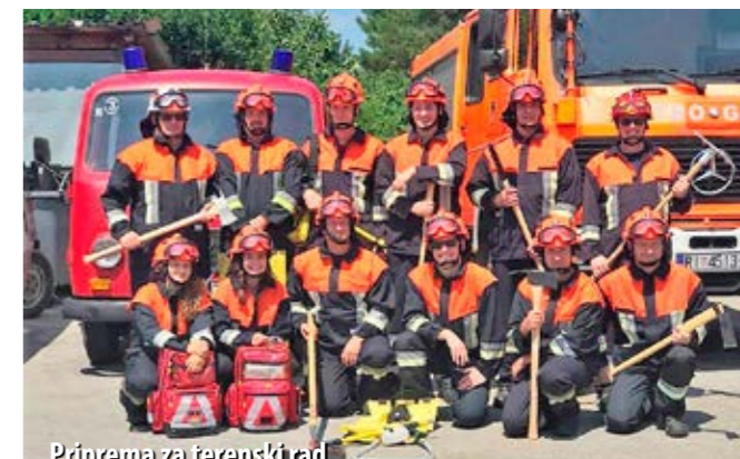
Priprema za terenski rad