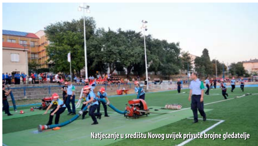
Natjecanje u središtu Novog uvijek privuče brojne gledatelje

Na tom vatrogasnom natjecanju nastupilo je 16 muških i šest ženskih A ekipa. U muškoj konkurenciji najbolji je bio DVD Sveti Križ Začretje, drugo mjesto osvojila je ekipa DVD-a Dolnja Rečica, a treće DVD Granešina. U ženskoj konkurenciji slavila je ekipa DVD-a Hrašće, drugi je bio DVD Sušak, a treći DVD Voloder.